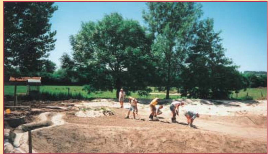
Naturbadeteich „INNATURA“ 2001