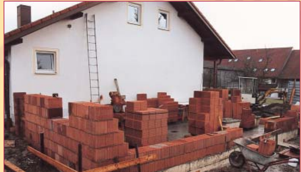
Anbau Sanitärhaus 2002