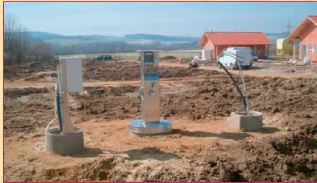
Campingplatzerweiterung Birnbachblick und Gutshofstellplätze 2005