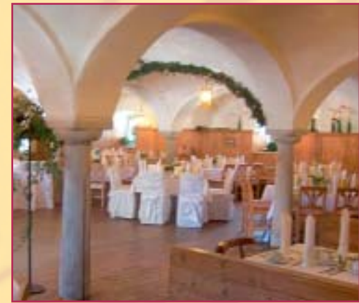
Ab 2006 wurde unser Roßstall zum Nostalgiewirtshaus mit feiner bayerischen Küche