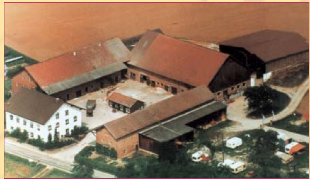
Der Hof 1977