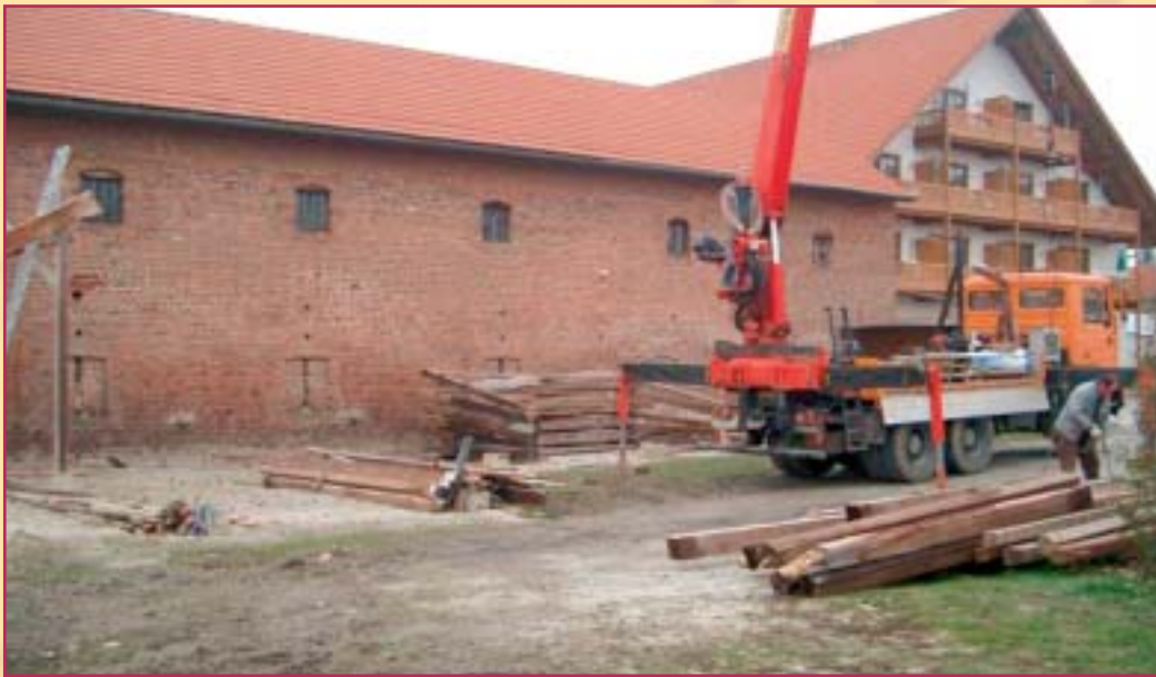
Neue Zufahrt & Carportanbau 2003