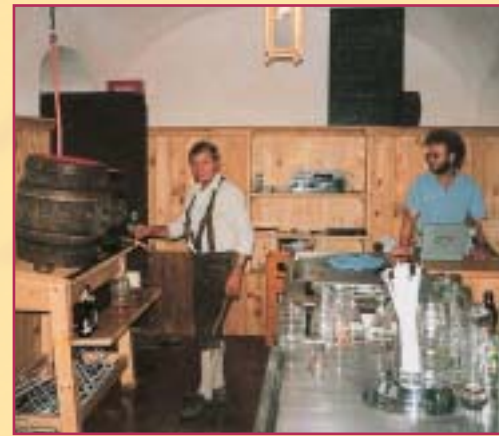
Gemeinsam mit unseren Gästen feierten wir viele Hofabende.

Seit 1987 ist der Arterhof ständig im Besitz eines Zwerggockels (Zwerghahnes). Der 1. Zwerggockel hieß Hansi und war als Einzelgänger unterwegs. Er erfreute alle Gäste (damals waren es nur eine überschaubare Menge) mit seinem schönen Gefieder. Er nächtigte im ehemaligen Pferdestall auf dem Podest am Lüftungsschacht. In dieser Zeit wurde aus dem Stall ein Gastraum gemacht. Dem Gickerl war das egal. Da er seinen Schlafplatz ja dort hatte, stolzierte er ohne Bedenken durch die offene Wirtshaustür. Die Gäste staunten nicht schlecht, als der Gickerl seine Runde auf der Tanzfläche drehte, auf den Tresen flog, anschließend auf die Tür und auf dem Podest am Lüftungsschacht landete, wo er einmal laut krächte und dann den Kopf einsteckte und schlief. Diese Prozedur wiederholte sich jeden Freitag am Hofabend. Die Gäste hielten dies mit ihren Fotoapparaten fest und fragten natürlich ständig nach der "Gickerleinlage". So wurde der Hahn zum Hofsymbol.