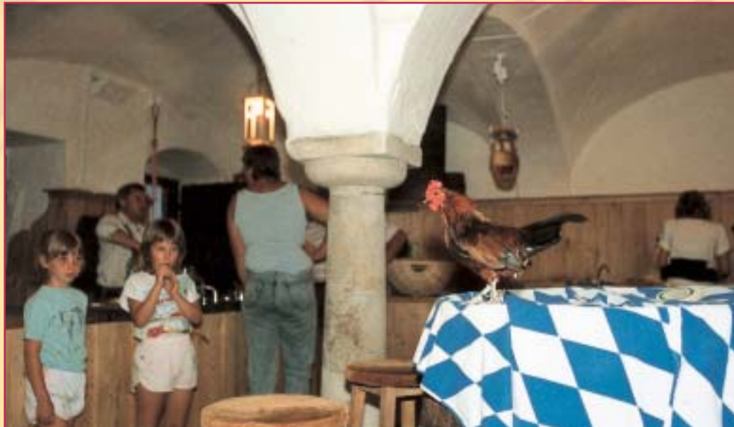
Der Gickerl in Aktion