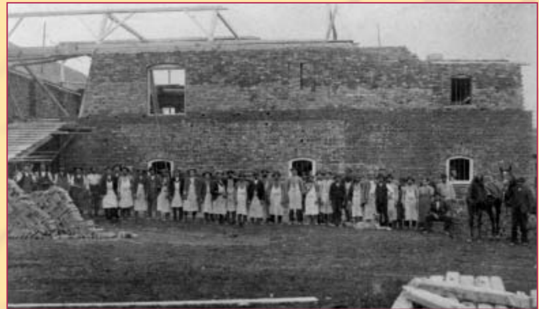
Bedienstete und Italiener beim Wiederaufbau des Hofes 1907