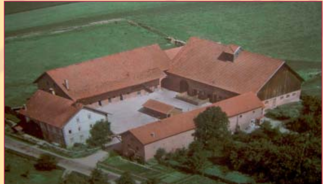
Arterhof im Jahre 1957