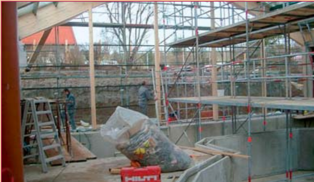
Bau des Pionierprojektes 1. tropisches Naturhallenbad Deutschlands 2004