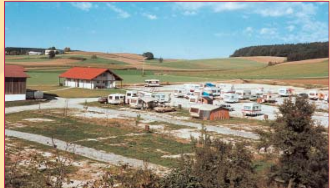
Oktober 1984 von Nachbar's Scheunendach