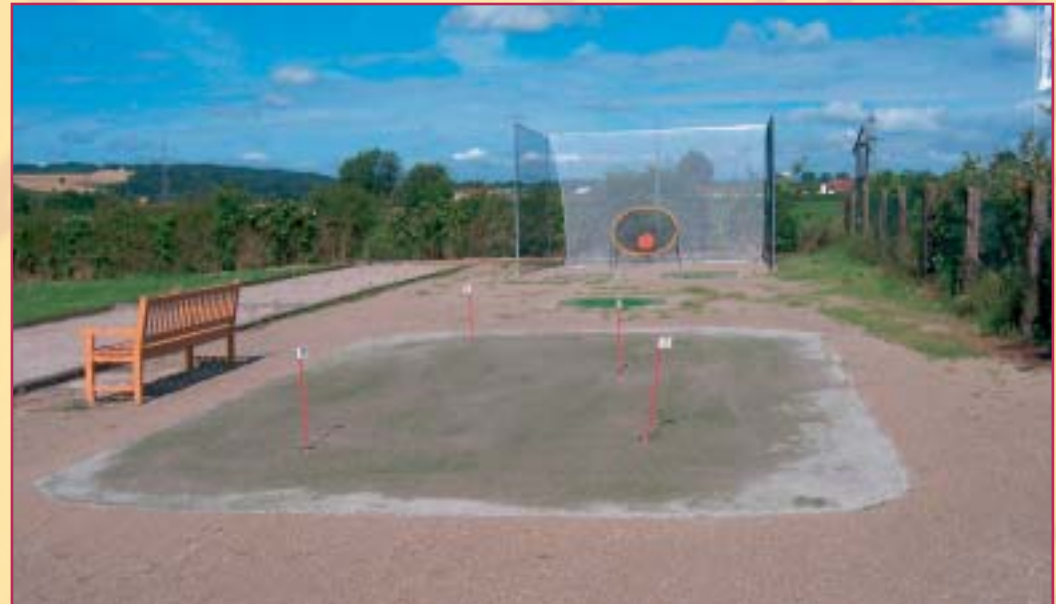
Golfübungsplatz im INNATURA