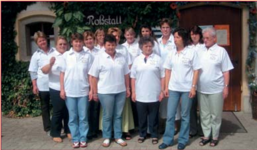
das Arterhof-Team sind ständig für Sie da!

Hauptstraße 3, Lengham • 84364 Bad Birnbach Tel. 0 85 63 / 96 13-0 • Fax 0 85 63 / 96 13 - 43 E-mail: info@arterhof.de • www.arterhof.de