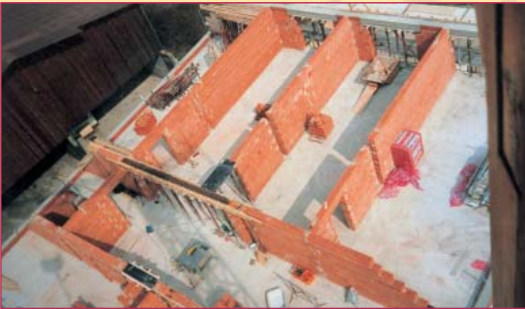
Umbau Appartements 1993