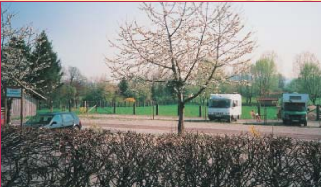
Bau der Arztpraxis und Wohnmobil - Übernachtungsplatz 2000