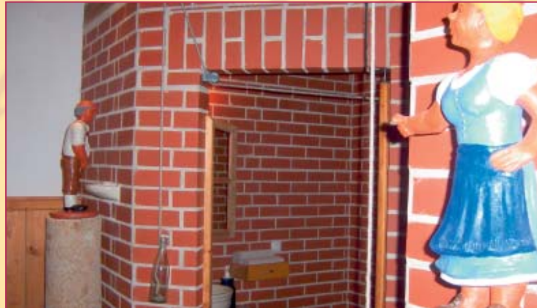
Neue Toilettenanlage im Roßstall 2006