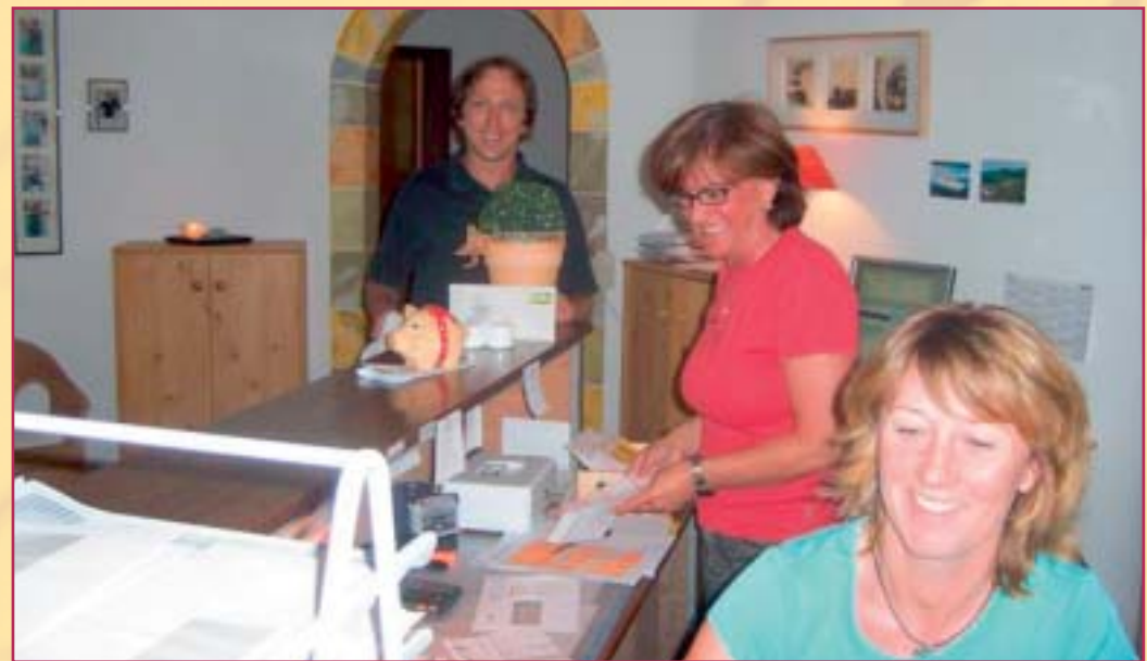
Neue Leitung in der Vitalwelt